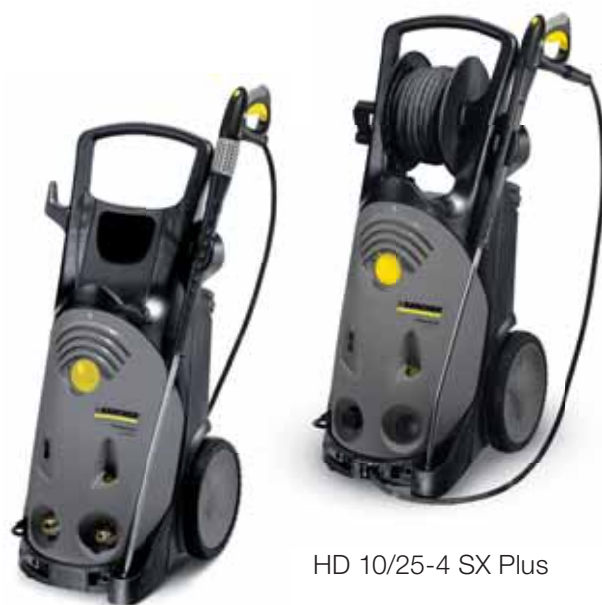
HD 10/25-4 SX Plus