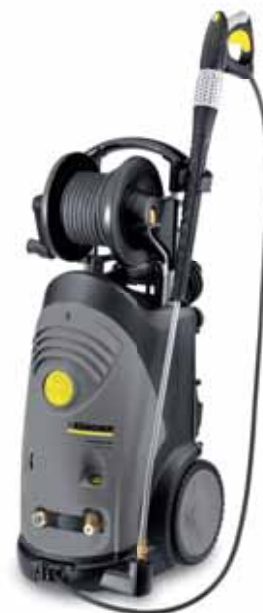
HD 9/20-4 MX Plus